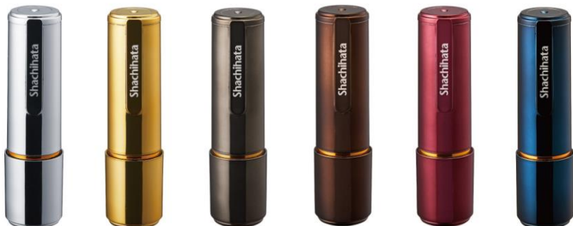
シルバーメタリック ゴールドメタリック グレーメタリック ブラウンメタリック レッドメタリック ブルーメタリック