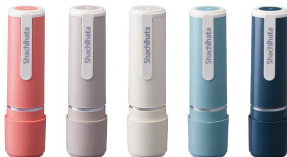
薄紅うすべに 桜鼠さくらねず 灰白はいじろ 浅葱鼠あさぎねず 青鈍あおにび