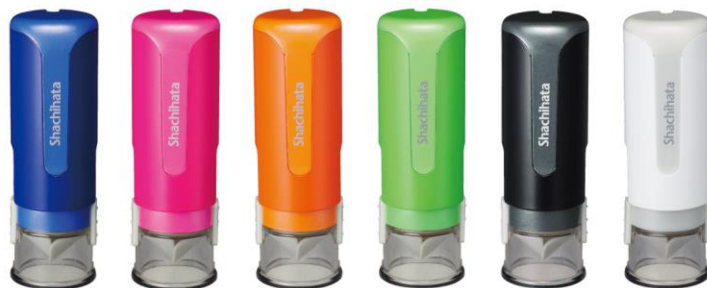
ブルー ピンク オレンジ イエローグリーン ブラック ホワイト