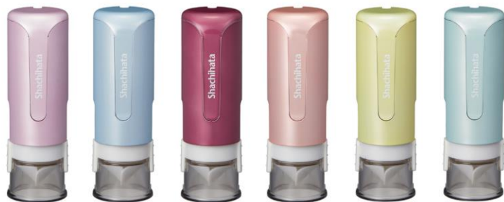
バイオレットフイズ ブルーレディ カシスソーダ ロゼピンク シャルドネゴールド モヒートブルー